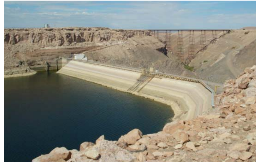
FOTO PRESA DEL EMBALSE CONCHI

De los resultados obtenidos de la modelación numérica se realizará el procesamiento de datos para la generación de mapas de inundación, zonas seguras y estimación de daños en las zonas afectadas.